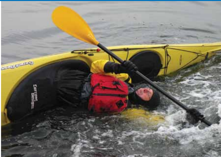
Kajakken er fin å sculle (oppdriftstak).